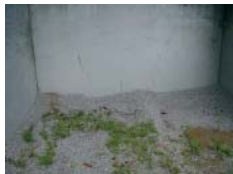
„Selbstbedienungsladen - Splittbox“

Die Marktgemeinde Waldhausen betreibt einige Streusplittlager für den Winterdienst. In letzter Zeit ist aufgefallen, dass vermehrt von diesen Lagern ungefragt Splitt, gleich einem Selbstbedienungsladen, entnommen wird. Es wird darauf hingewiesen, dass Streusplitt Eigentum der Marktgemeinde Waldhausen ist und grundsätzlich nur kostenpflichtig abgegeben werden kann. Jedenfalls ist vor einer Entnahme das Einvernehmen mit der Marktgemeinde Waldhausen herzustellen. Gleichzeitig ist zu bemerken, dass unerlaubte Entnahmen einem Diebstahl gleichzustellen sind.