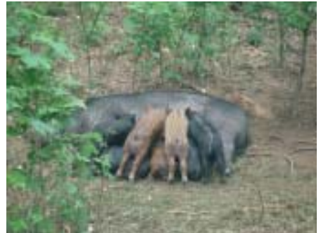
Hausschwein Frida mit Nachwuchs