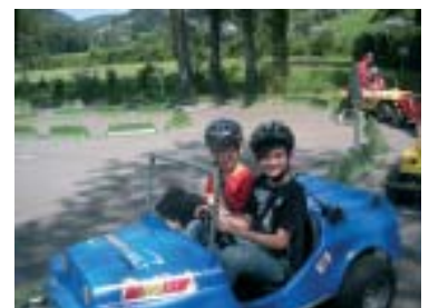
Verkehrserziehung der etwas anderen Art mit „Jumi Cars“

Am 29. Juni 2010 konnten Schüler/innen erstmals ihre „Führerscheintauglichkeit“ überprüfen. Mit „Jumi Cars“ (Benzinautos) wurde im Zuge eines Verkehrstrainingsprogramms von den „Führerscheinneulingen“ der Alltag geprobt. Nach bestandendem „Führerscheintest“ durfte mit den Autos in Übungsparcours (Kötttsdorfer Garten) getestet werden. Diese Verkehrserziehung machte nicht nur Spaß, sondern ist im Straßenverkehr nahezu lebensnotwendig.