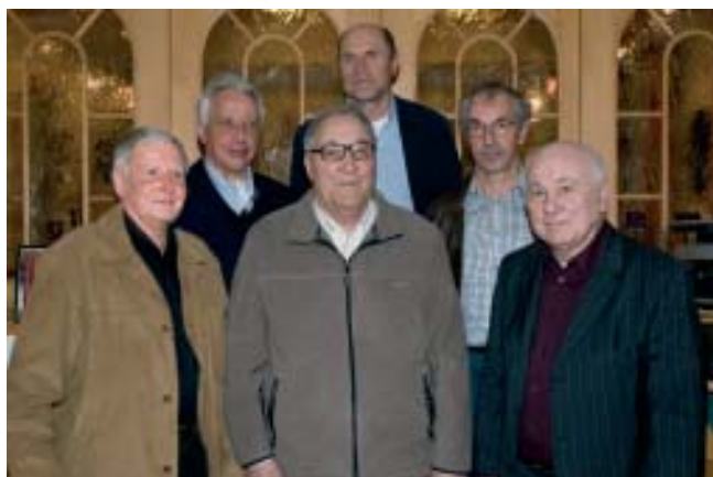
Gründerväter der Union Waldhausen aus dem Jahre 1968