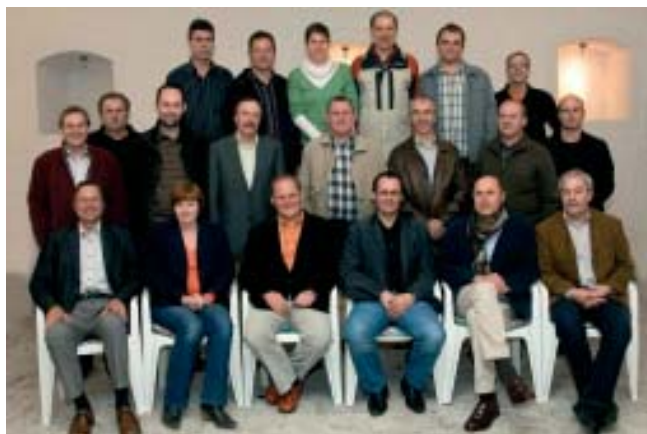
Der neu gewählte Union-Vorstand

Landwirtschaftskammer Oberösterreich - Blumenschmuckaktion