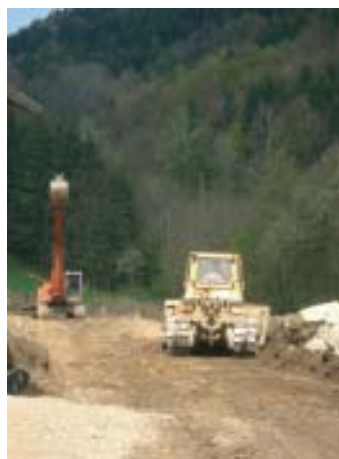
Bauetappe Güterweg Temper

Die Asphaltierungsarbeiten beim Güterweg Sattlgai konnten bereits abgeschlossen werden. Die diesjährige Bauetappe beim Güterweg Temper steht kurz vor der Fertigstellung. Die Rohtrasse wurde inklusive einer leichten Beschotterung fertig gestellt.