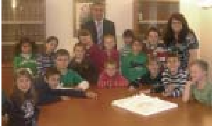
Klasse 3b der VS Waldhausen mit Bgm. Gassner und VOL Pilz

Am 17. Mai 2010 besuchte uns die Klasse 3b der Volksschule Waldhausen am Gemeindeamt. Nach einem Rundgang beantwortete ich in einer Diskussionsrunde Fragen und nahm Vorschläge (Gestaltung Spielplätze) der Jungbürger von Waldhausen entgegen.