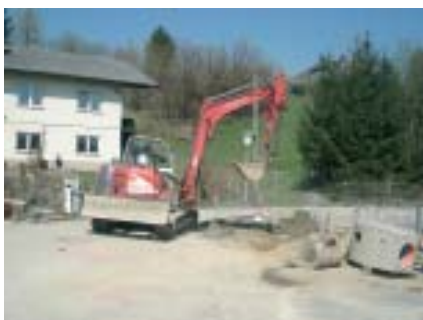
Baustelle - Siedlung Marktblick

Mit der Errichtung des Kanales und der Wasserversorgung in der Siedlung Marktblick wurde begonnen. Es sind alle bemüht, die Bauarbeiten so rasch als möglich durchzuführen.