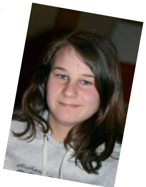
Text & Interviews: Magdalena Schauer

ÖSTERREICHISCHES ROTES KREUZ OBERÖSTERREICH