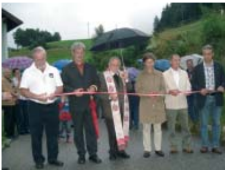
Eröffnung GW Hasenberg bei schlechten Witterungsverhältnissen