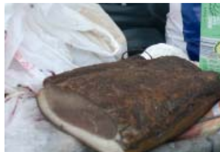
Müllentsorgung - so nicht ...

Es wird immer öfter festgestellt, dass Lebensmittel im Müll landen (siehe Foto). Ich ersuche dies tunlichst zu unterlassen. Lebensmittel kann man anders verwerten. Es wird in nächster Zeit besonders darauf geachtet.