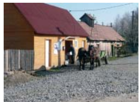
Milchanlieferung an die neu errichtete Sammelstelle. Haupteinnahmequelle für die Bevölkerung in Palpataka.