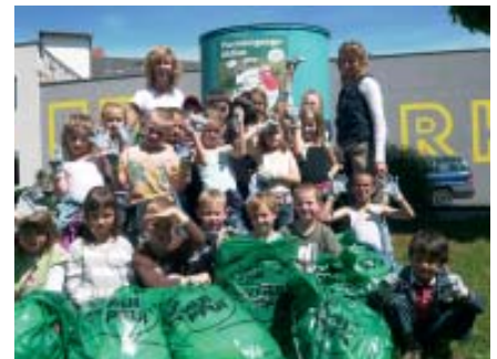
Die 1a-Klasse mit dem gesammelten Müll

Text: VS-Dir. Franz Reiter