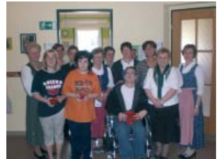
Die Goldhaubenfrauen zu Besuch im Förderzentrum Waldhausen

Text: Anna Buchsbaum