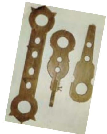
Verschiedene Schand- oder Halsgeigen