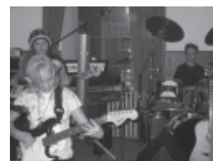
Girls & Boy: Power und Action garantiert

18.04.08 Konzert mit den Tagwerkern 04.05.08 Union Messe - Gestaltung